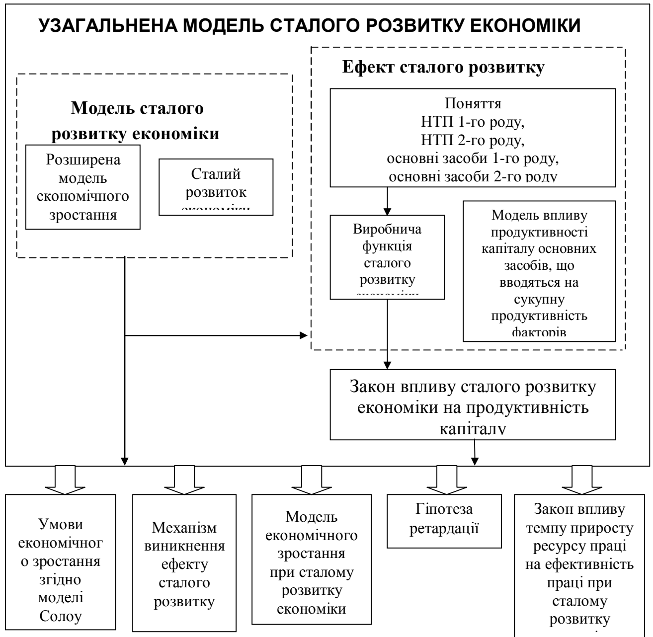
Рис. 2. Структурна схема сталого розвитку економіки

Структурна схема сталого розвитку економіки з урахуванням наукових досягнень авторів кафедри економіки та підприємництва подана на рис. 2.